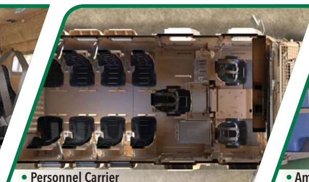
• Personnel Carrier